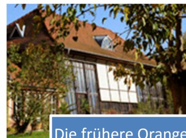
Die frühere Orangerie