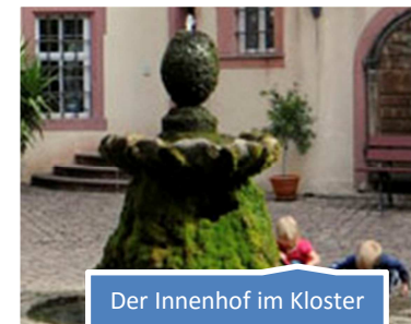
Der Innenhof im Kloster